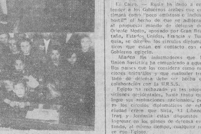
Las Cajas de Ahorro benéficas de nuestra ciudad, celebraron ayer distintos actos —cuyas reseñas dejamos para la próxima edición, a causa de la abundancia de originales— para conmemorar el «Día Universal del Ahorro»...