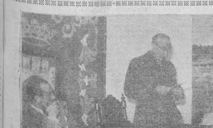
Los momentos de los solemnes actos celebrados ayer tarde en el histórico Monasterio de Cardena, con motivo de la apertura de curso académico de la Institución «Fernán González». El hito inaugurado a la entrada de la Abadía y el señor duque de Alba durante su discurso en la sesión académica.