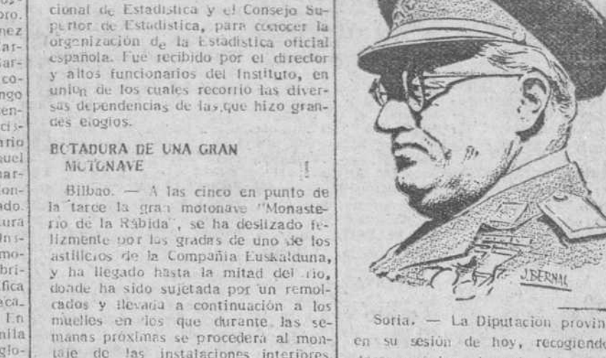
Soria. — La Diputación provincial, en su sesión de hoy, recogiendo el deseo unánime de todos los Ayuntamientos de la provincia, ha tomado el acuerdo de nombrar hijo predilecto de la misma al teniente general Yagüe.

Ha sido adoptado el acuerdo recogiendo el deseo unánime de todos los Ayuntamientos