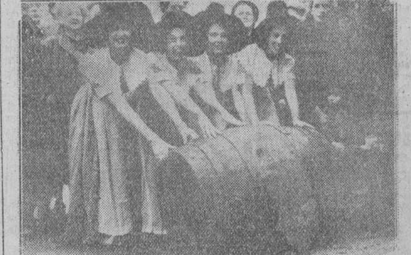
LONDRES. — EN EL CENTRO DE LONDRES SE ESTA CONSTRUYENDO UNA TABERNA AL ESTILO ANTIGUO QUE FUNCIONARA DURANTE EL FESTIVAL BRITANICO CON SUS SERVIDORES ATAVIADOS CON TRAJES MEDIEVALES. ESTE GRUPO DE MUCHACHAS, ATAVIADAS A LA ANTIGUA USANZA, HACEN RODAR UNO DE LOS BARRILES DE VINO DESTINADOS AL TIPICO ESTABLECIMIENTO.