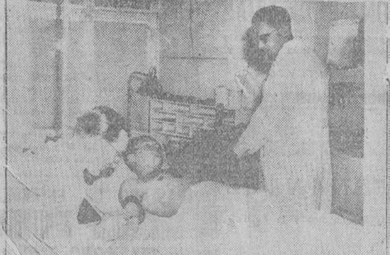
INVESTIGADORES BRITANICOS ENSAYAN SUS ULTIMOS DESCUBRIMIENTOS EN MATERIA DE SUSTANCIAS Y PRODUCTOS ATOMICO-RADIOACTIVOS Y SU APLICACION EN EL DIAGNOSTICO Y LOCALIZACION DE LAS ENFERMEDADES DEL CORAZON.