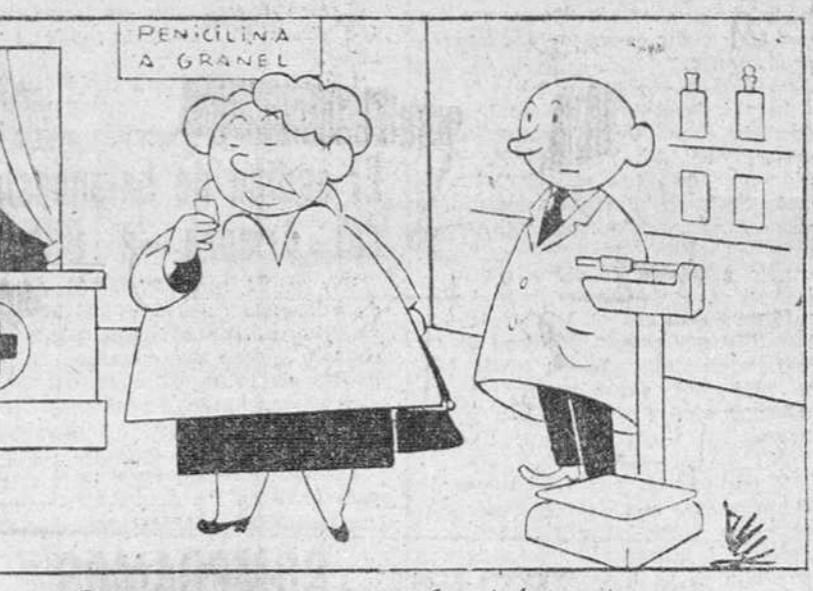
—Lo siento, señora, pero el patrón es tan escrupuloso que no consiente que robemos en el peso.