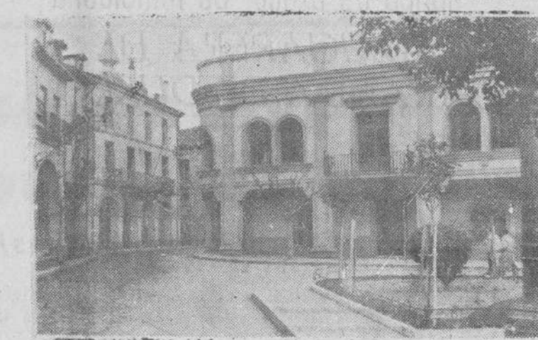
UN RINCON DE LA PLAZA DEL CAUDILLO

grados y una escuela de párvulos y que para fecha próxima pensamos pedir la creación de seis grados más y otra escuela de párvulos, con lo que pronto tendremos en Aranda veintidos escuelas, de grado, dos de párvulos y además otras dos preparatorias para ingreso en el Instituto, en las que los niños que pretenden seguir los estudios de bachillerato puedan adquirir una preparación especialmente enca-