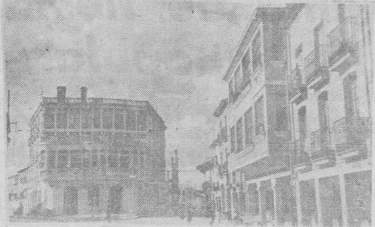
CALLE DE SAN FRANCISCO

nueva riada de vida se verifique la transformación necesaria que todos ansiamos y que ya no se ha de hacer esperar, entonces será el momento oportuno de comprobar si los dichos son hechos o son fruto de una contrariedad de la que jugó más papel el insonor y la soberbia de quien ha sufrido una herida en su amor propio. A los pueblos no hay que juzgarlos por lo que se ve en una circunstancia especial, sino después de estudiarlos a fondo y conocer el por qué de lo que son.