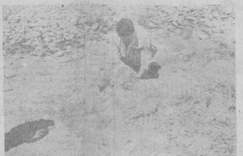
Alicante. — En la playa el fotógrafo captó esta pieza de un joven escultor playero modelando en la arena su pequeña obra de arte. ¿La Esfinge o la Dama de Elche? Eso sólo lo sabrá el mar...