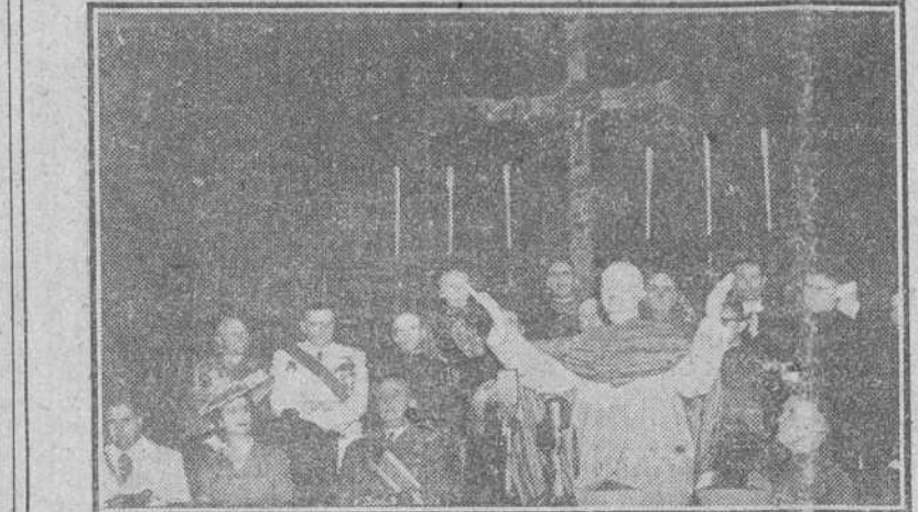
Vich. — El Cardenal Tedeschini durante su discurso en la clausura del Congreso de Apologética del Centenario de Balmes, que presidió S. E. el Jefe del Estado.

Su Excelencia efectuó entrega de guiones a varias centurias del Frente de Juventudes