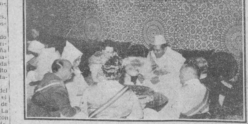
Tetuán.— S. A. I. el Jalifa con el Alto Comisario de España en Marruecos y otras distinguidas personalidades, que asistieron a una de las comidas celebradas en el Palacio del Mexuar con motivo de la próxima boda de S. A. I. con la princesa Lal-La Fatima.