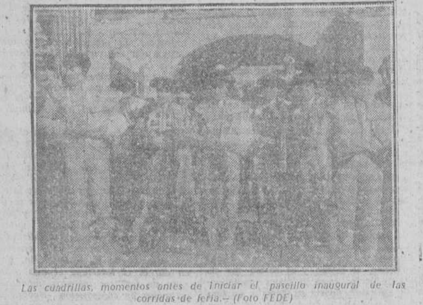
Las cuadrillas, momentos antes de iniciar el paseo inaugural de las corridas de ferias.

CHAMARILERO GALZADOS SORIA San Juan, 57 Teléfono 1860 Frente al Mercado Norte BURGOS