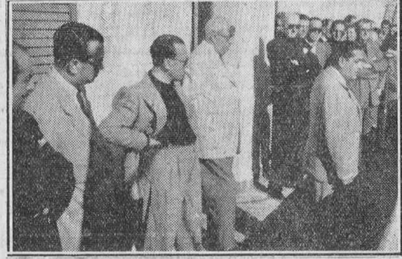
Dos momentos del brillante acto inaugural del "Hogar del Productor", de Miranda de Ebro. — La bendición del nuevo edificio y el subsecretario de Trabajo dirigiendo la palabra a la multitud.

diversos momentos con calurosos aplausos y vitores.