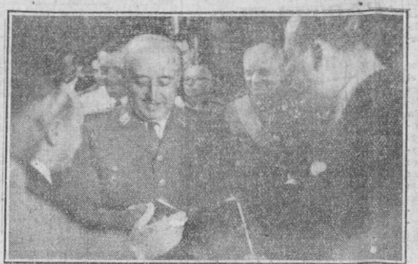
El Pardo. — S. E. el jefe del Estado recibió en audiencia a una representación de la Prensa española, que con ocasión del XIII aniversario del Alzamiento nacional, ofreció al Caudillo el primer carnet de periodista y un album con los nombres de los periodistas caídos por Dios y por España.