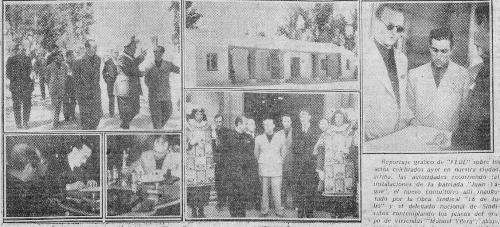
Reportaje gráfico de "FEDE" sobre los actos celebrados ayer en nuestra ciudad: arriba, las autoridades recorriendo las instalaciones de la barriada "Juan Yagüe"; el nuevo consultorio allí inaugurado por la Obra Sindical "18 de Julio" y el delegado nacional de Sindicatos contemplando los planos del grupo de viviendas "Manuel Yllera"; abajo, tres momentos de la ceremonia de firma de cesión de terrenos.