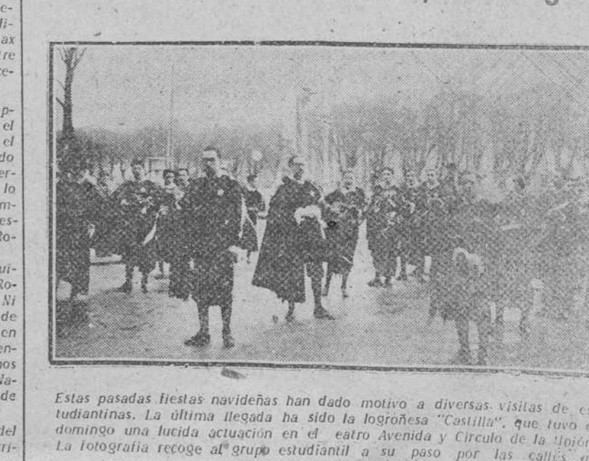
Estas pasadas fiestas navideñas han dado motivo a diversas visitas de estudiantinas. La última llegada ha sido la logroñesa "Castilla", que tuvo el domingo una lucida actuación en el teatro Avenida y Círculo de la Unión. La fotografía recoge al grupo estudiantil a su paso por las calles de nuestra ciudad.