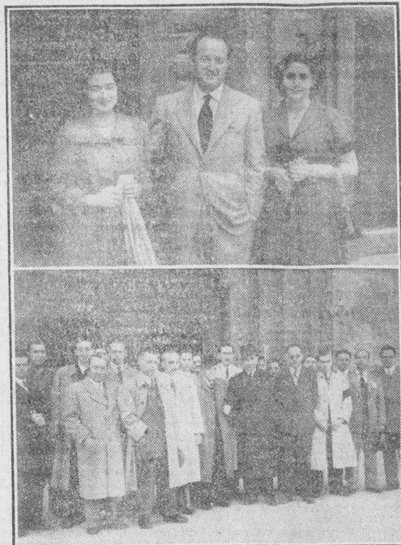
El ministro de España en Asunción, don Miguel Teus, visitó ayer nuestra ciudad. En el grabado que aparece en el plano superior, el ilustre viajero, con sus acompañantes, saliendo de la Catedral. En nuestra segunda foto, un grupo de subdirectores y agentes de Seguros de nuestra ciudad, después de asistir a la solemne ceremonia religiosa celebrada con motivo del "Día del Seguro".