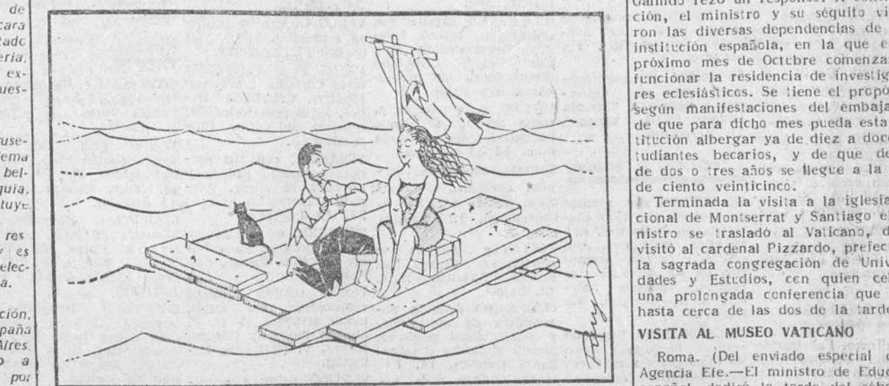
—Yo le juro, señorita, que para mí no hay en el Mundo otra mujer que usted.