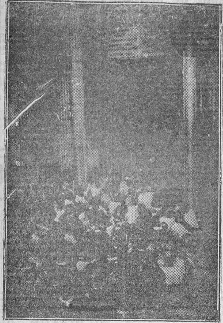
Ciudad del Vaticano.—Un momento de la solemne ceremonia durante la cual Su Santidad el Papa procede a la apertura de la Puerta Santa de la Basílica Patriarcal de San Pedro, como iniciación del Año Santo de 1950.