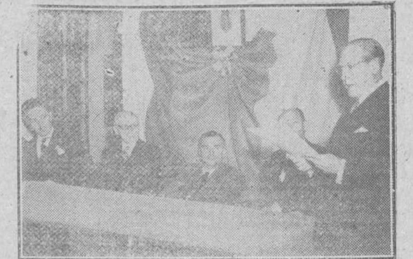
Quito. -- El vicepresidente de la República ecuatoriana, el director del Instituto hispanico y otras altas personalidades durante el acto inaugural de la Biblioteca hispanica de esta ciudad.