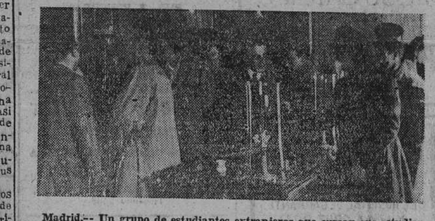
Madrid.—Un grupo de estudiantes extranjeros que cursan sus estudios en esta capital, han visitado la hemeroteca Municipal...