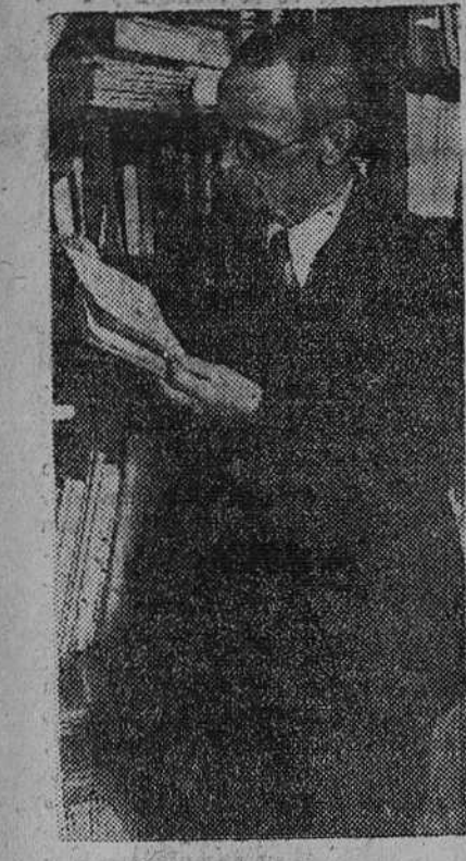
El alemán Hermann Hesse, al cual le ha sido concedido el premio Nobel de Literatura