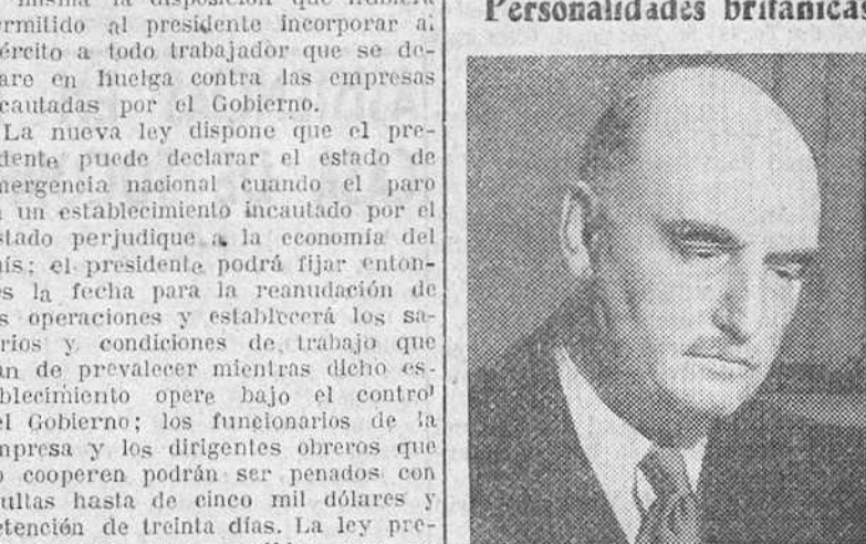
Sir Arthur Steel, vicepresiente del Consejo Nacional británico del carbón