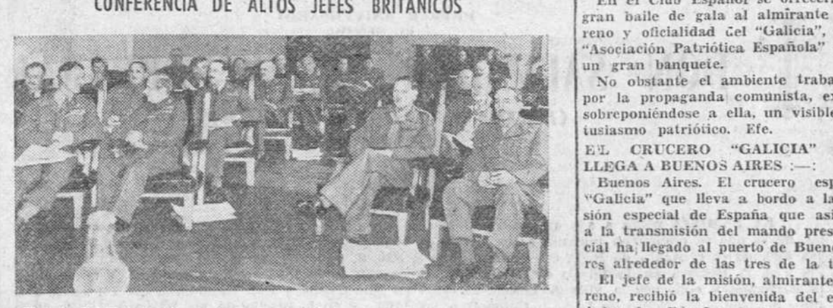
El jefe del Estado Mayor imperial británico, Lord Alanbrooke, celebró recientemente en Camberley, una conferencia con los comandantes en jefe ingleses. Esta fotografía está tomada durante la reunión.