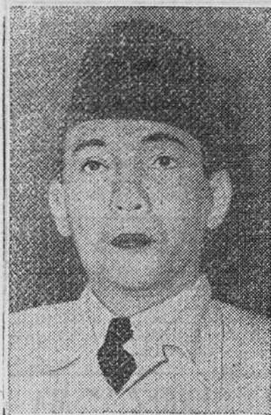
EL PRESIDENTE SUKARNO

Antes de la proclamación del estado de sitio Sukarno, Sjahrir y el Gabinete celebraron varias reuniones que, según Sjahrir, estaban destinadas a "reforzar el Gobierno y prepararlo contra toda eventualidad".—Efe.