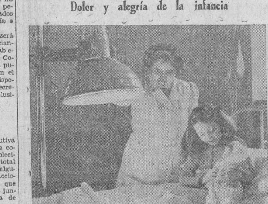
Esta pequeña, sometida a tratamiento (diatérmico en el hospital nacional ortopédico de Londres, goza de un momento de alegría con una preciosa muñeca que le ha sido regalada en las fiestas navideñas.