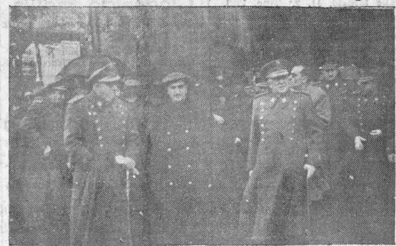
Las autoridades burgalesas, a la salida del templo de la Merced, después de la solemne fiesta religiosa-militar celebrada el domingo último con motivo de la festividad de la Inmaculada Concepción