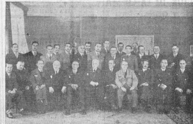
Un grupo de letrados burgaleses, reunidos el pasado domingo para conmemorar la festividad de su exacta Patrona, la Inmaculada Concepción de Nuestra Señora, (Foto FEDE)