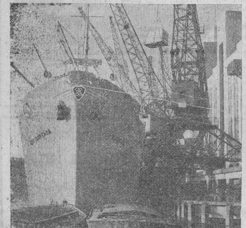
El mayor suceso "Ada Gother", de 6.000 toneladas, descargando frutas en el muelle de Londres. Entre los marinos ingleses se conoce a este muelle con el original nombre de "muelle del pescado fresco"

Nueva York.—Las manchas solares han dificultado extraordinariamente las comunicaciones en los Estados Unidos y el Canadá, así como la recepción de las señales radiofónicas de Extremo Oriente.—Efe.