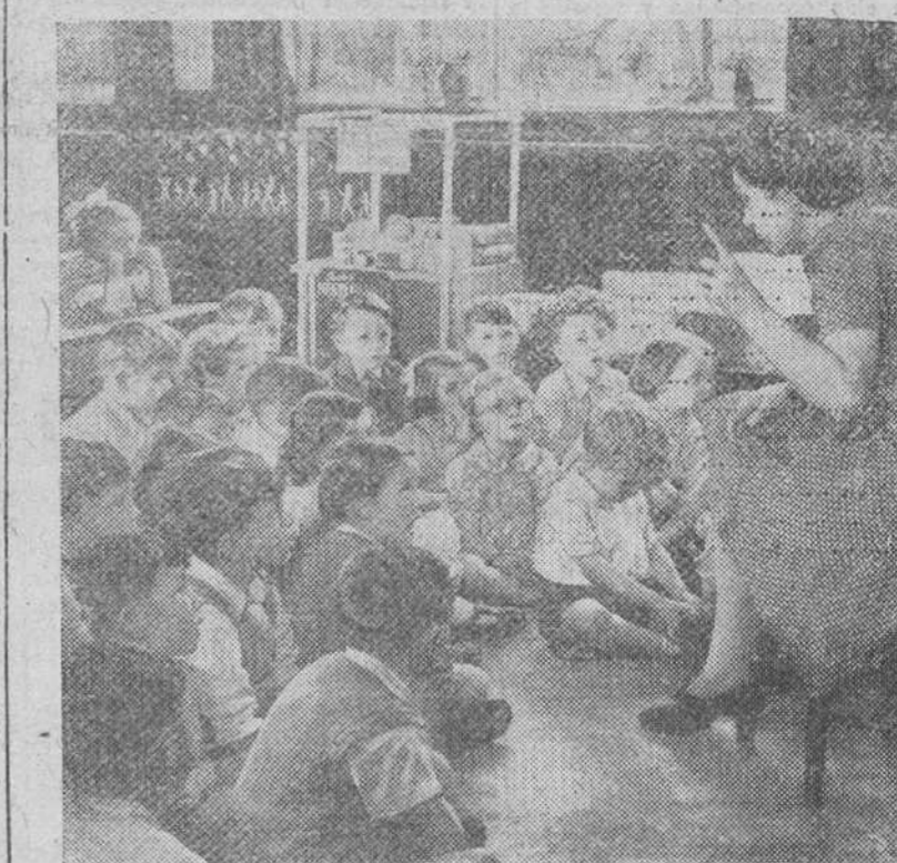
La maestra de una escuela, en el Sur de Inglaterra, explica la lección a los pequeños empleando un nuevo método de enseñanza: la explicación a viva voz