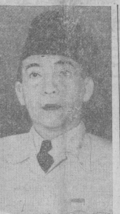
EL PRESIDENTE DE INDONESIA

Al abrirse la sesión del Consejo de Seguridad, Manuiski fué invitado a presentar su acusación, después que el Consejo anotó en su orden del día la presentada por Siria y el Líbano, solicitando la retirada inmediata de las tropas británicas y francesas. Manuiski empezó a leer