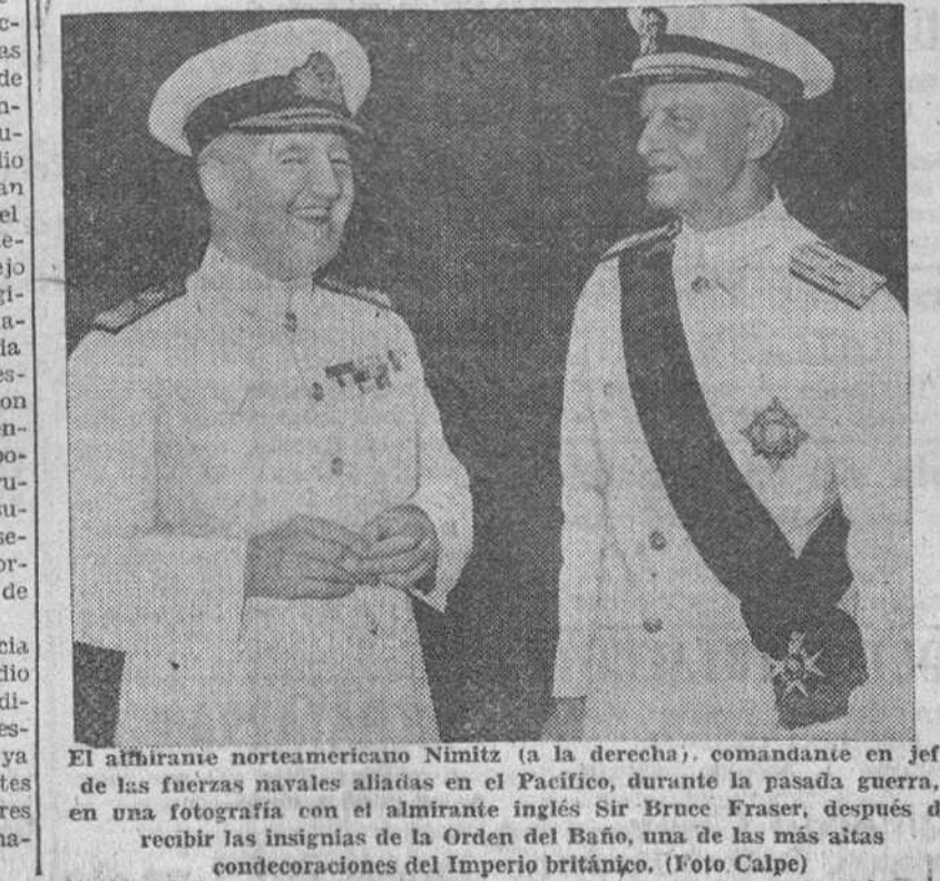
El afirmante norteamericano Nimitz (a la derecha), comandante en jefe de las fuerzas navales aliadas en el Pacífico, durante la pasada guerra, en una fotografía con el almirante inglés Sir Bruce Fraser, después de recibir las insignias de la Orden del Baño, una de las más altas condecoraciones del Imperio británico.