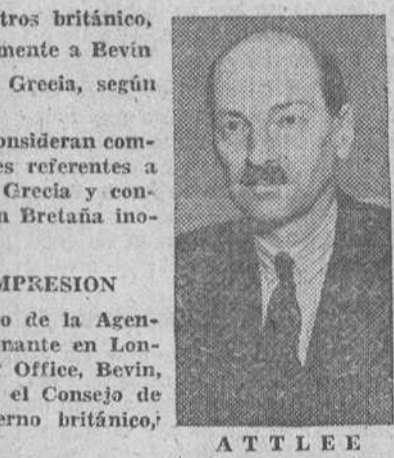
A T T L E E

Ensenada (Méjico).— El gobernador de Sonora ha anunciado que el barco de carga mejicano "Santo Tomás" se hundió al tratar de salvar al pesquero norteamericano "Mabel". La tripulación del pesquero, 14 tripulantes del "Santo Tomás" y 57 pasajeros de éste, han sido salvados.—Efe.