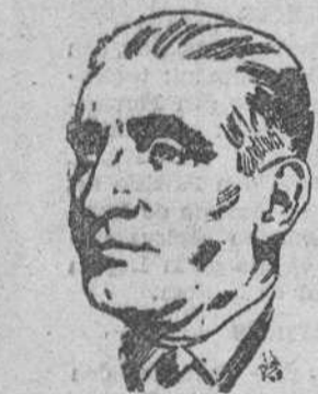
El presidente Ríos

RÍOS SE MANTENDRÁ ALEJADO TEMPORALMENTE DE LA POLÍTICA