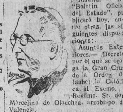
Marcelino de Obechea, arzobispo de Valencia.

Reglamentación del trabajo en las Industrias de captación, elevación, conducción y distribución de agua