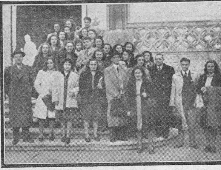
El pasado jueves, llegó a Burgos, un grupo de alumnos de ambos sexos de la Universidad de Valladolid, acompañado de varios de sus profesores, los cuales visitaron los templos y monumentos artísticos burgaleses en un viaje de carácter catártico...