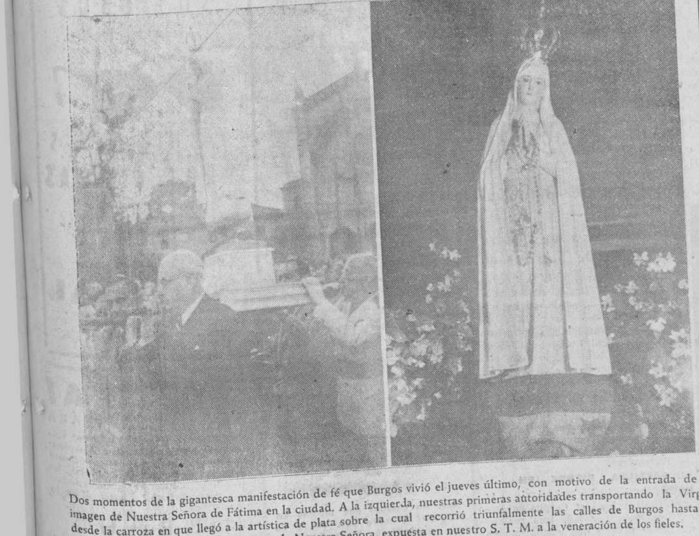
Dos momentos de la gigantesca manifestación de fe que Burgos vivió el jueves último, con motivo de la entrada de la imagen de Nuestra Señora de Fátima en la ciudad. A la izquierda, nuestras primeras autoridades transportando la Virgen desde la carroza en que llegó a la artística de plata sobre la cual recorrió triunfalmente las calles de Burgos hasta la Catedral. A la derecha, la imagen de Nuestra Señora, expuesta en nuestro S. T. M. a la veneración de los fieles.