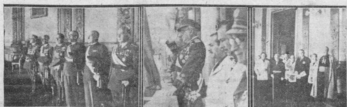
Reportaje gráfico de la solemne recepción celebrada ayer, con motivo del XI aniversario del Glorioso Movimiento nacional, en el centro del capitán general de la región, presenciando el desfile de las tropas que rindieron honores a ambos lados los generales y jerarquías eclesiásticas y civiles durante el acto.

PASTORA PENA Madrid.—Su Excelencia el Jefe del Estado ha inaugurado esta mañana en Carabanchel los establecimientos de la Beneficencia general, orfanato nacional de El Pardo e Instituto de niños anormales "Fray Bernardino Álvarez" enclavados en la posesión de Vista Alegre.