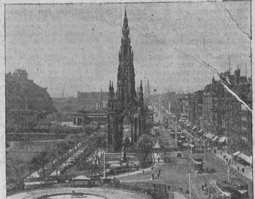
Desde el pasado domingo, se están celebrando en Edimburgo grandes festivales filarmónicos en los que participan las más famosas organizaciones musicales del mundo, entre ellas las Filarmónica de Viena, Liverpool y Glasgow. La foto nos muestra en la famosa calle de Princes Street, en la ciudad inglesa.

LA REALIDAD AMERICANA TRIUNFA SOBRE TODOS LOS CONVENCIONALISMOS Por segunda vez, Velasco Ibarra ha sido depuesto mientras se celebraba una Conferencia internacional