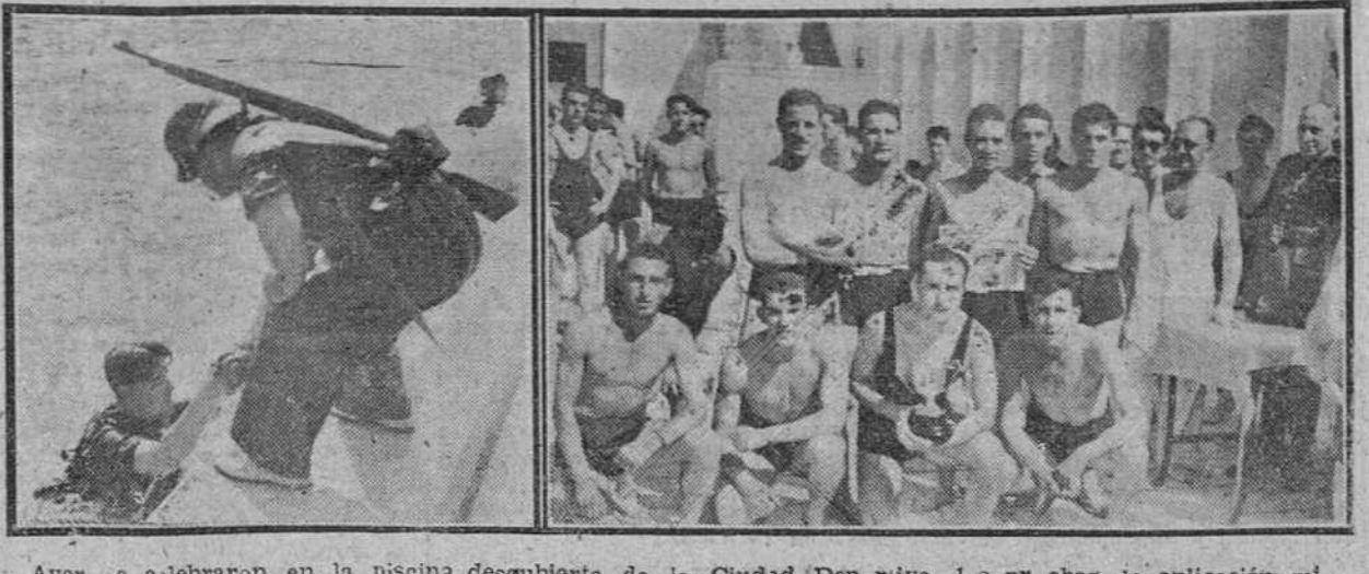
Ayer se celebraron en la piscina descubierta de la Ciudad Deportiva, las pruebas de aplicación militar con intervención de varias patrullas...