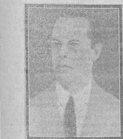
D. PEDRO RADIO

Emocionado brindis del nuevo embajador argentino ante el ayuntamiento barcelonés