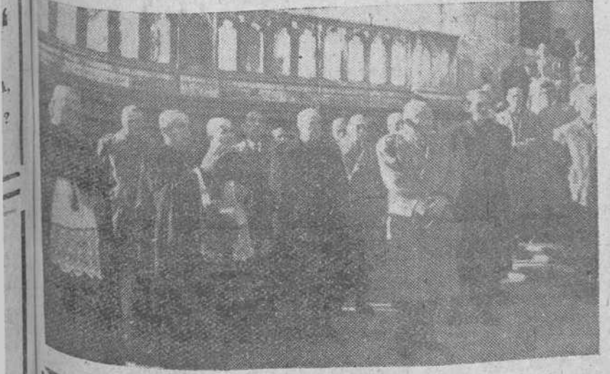
Grupo de autoridades y jerarquías en la escalinata del Sarmiento de la Santa Iglesia Catedral, ante la Cruz de los Caídos, durante el responso rezado con motivo de la conmemoración del «Día de José Antonio y de los Caídos» en nuestra ciudad.