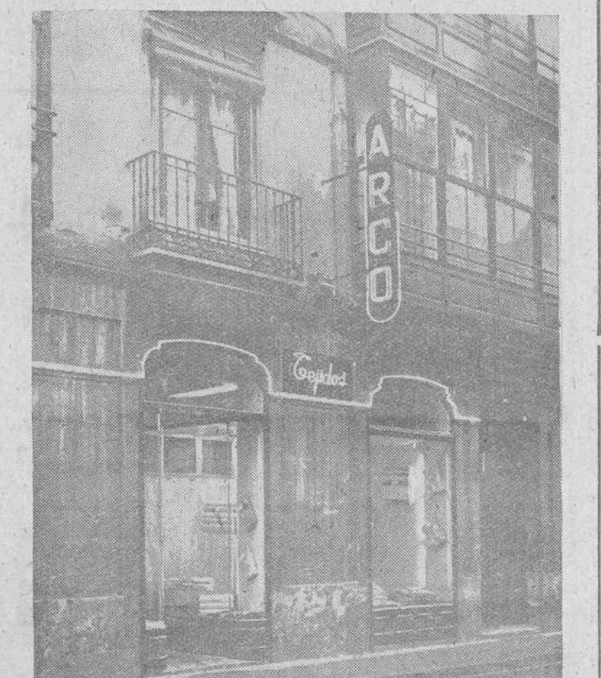
En una de las calles de más solera, en el antiguo Burgo, ARCO abre sus puertas al público, bajo el lema de la cordialidad y la economía.