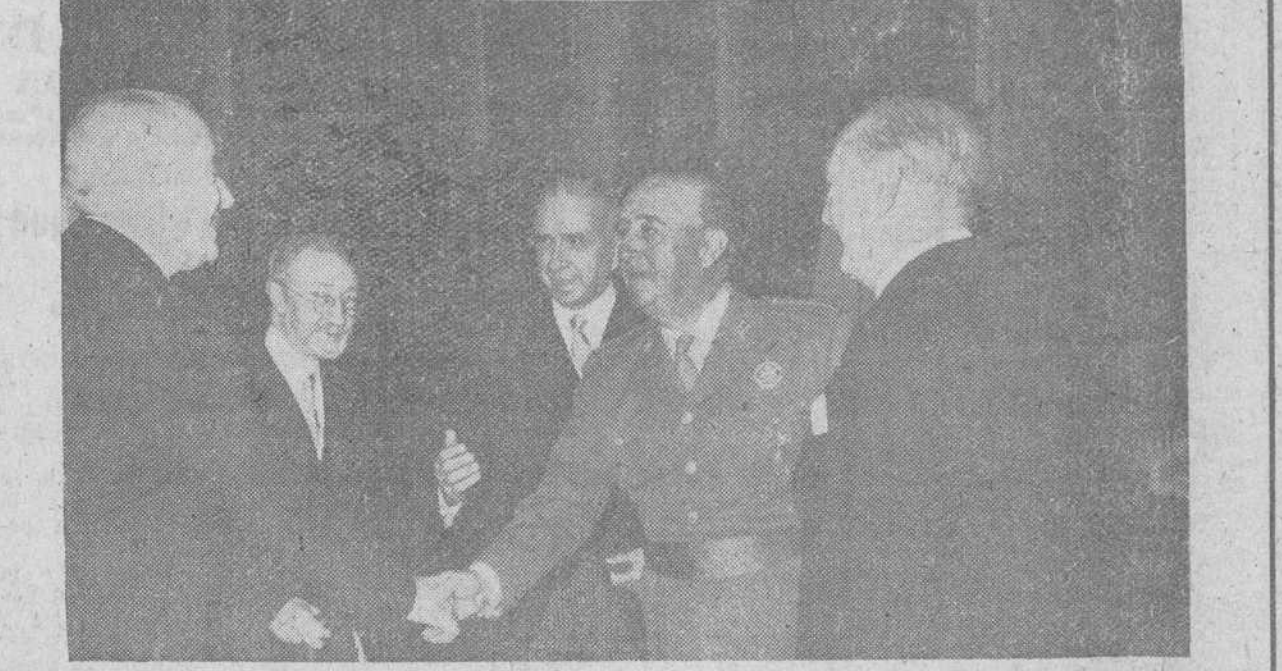
Madrid. — S. E. el Jefe del Estado, durante la audiencia concedida a la comisión de la Junta Directiva de la Asociación española para el Progreso de las Ciencias, presidida por don Manuel Lora Tamayo, que cumplimentó al Caudillo para darle cuenta del desarrollo del Congreso y entregarle la Medalla de presidente de honor.

Dos cláusulas rusas relativas a la creación de un organismo internacional del espacio son aceptadas en las Naciones Unidas Sede de las Naciones Unidas. — Estados Unidos y otros diecinueve países patrocinadores de una moción occidental sobre el espacio exterior, han acordado aceptar dos cláusulas clave de una medida soviética de compromiso encaminada a establecer un organismo internacional del espacio con carácter permanente. El embajador norteamericano, Henry Cabot Lodge, ha conferenciado con el viceministro soviético de Asuntos Exteriores, Valerian A. Zorin, para tratar de lograr una resolución conjunta soviético-occidental, que conseguiría la aprobación unánime de la Comisión política principal. Se espera que el Sr. Lodge, en el que delegarán los demás representantes, y Zorin, lleguen a un acuerdo sobre una fórmula, la moción conjunta presentada por ambos sería aprobada por unanimidad por la comisión política principal y después por la Asamblea general. — Efe.