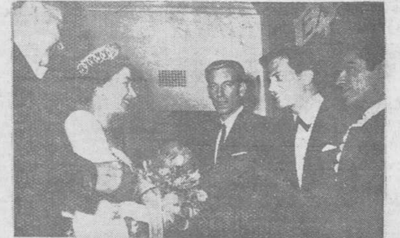
La Reina Isabel de Inglaterra aparece en nuestra foto felicitando a los artistas: Ron Parry, comediante; Pat Boone, cantante americano; y nuestro inconfundible compatriota Antonio, que actuaron con gran éxito, en el Royal Variety Show, en el Coliseum, de Londres.