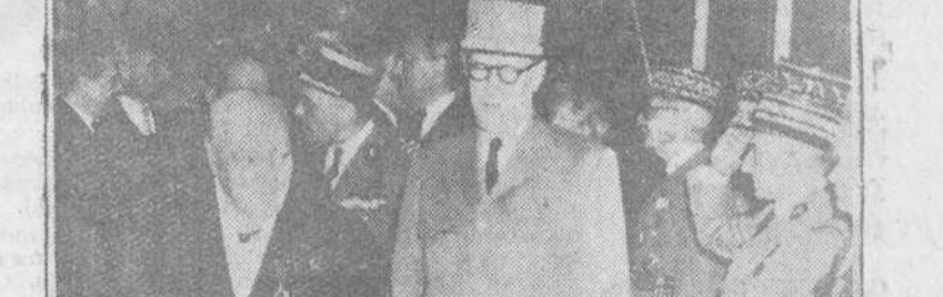
Paris. — El ex-premier británico, Wiston Churchill, acompañado del general De Gaulle, momentos después de haber sido impuesta la Cruz de la Orden de la Liberación, en la solemne ceremonia celebrada en el Hotel Matignon por el primer ministro francés.

Estos huecos ayudarán a la Comisaría de Abastecimientos y Transportes a compensar la disminución del rendimiento de los galineros durante el invierno.