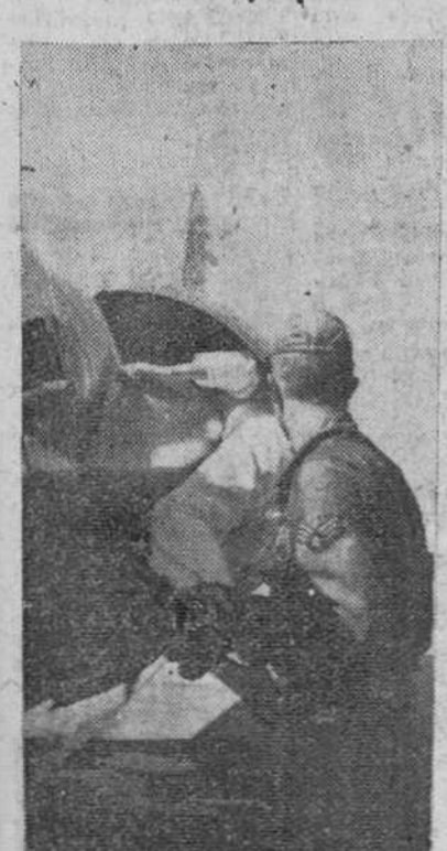
Base Aérea de Torrejón.—Para la mejor revisión de los motores de los aviones reactores, en la Base de Torrejón presta servicio un mecánico de pequeña estatura, que tiene a su cargo la difícil misión de introducirse en las turbinas para su limpieza y puesta a punto. En la foto, el pequeño mecánico durante su trabajo en uno de los modernos reactores de la base.