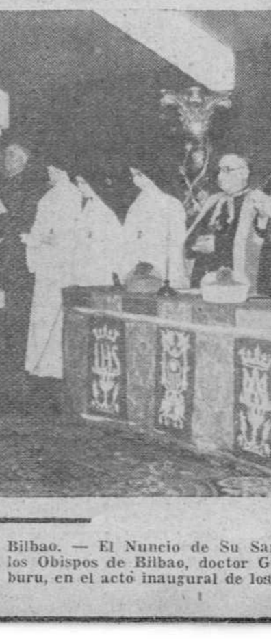
Bilbao. — El Nuncio de Su Santidad, Monseñor Antoniutti, con los Obispos de Bilbao, doctor Gúrpide y de Wuhu, doctor Arráburu, en el acto inaugural de los cursillos de Misioneras, en Bézir.