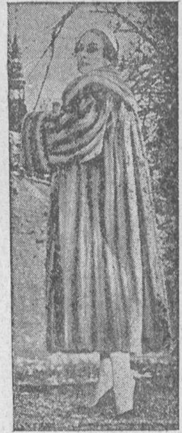
He aquí el sueño de cualquier mujer. Abrigo de visón, de piel hasta media pierna, exquisitamente confeccionado por el A. C. Bang de Copenhague.

Se disimulan en las joyas de piel, a las veces, un origen humilde; por ejemplo, el conejo. Así, dicho de pronto, parece que la cunicultura sea cosa únicamente casera. No obstante, del estudio actual de los "genotipos" y de la fomentación, depuradísima, de fábricas de curtido y tintes, de preparación e imitación, está naciendo una Cunicultura pródiga de pieles de prodigio. Atención pues, al hilado y tejido, de manufactura