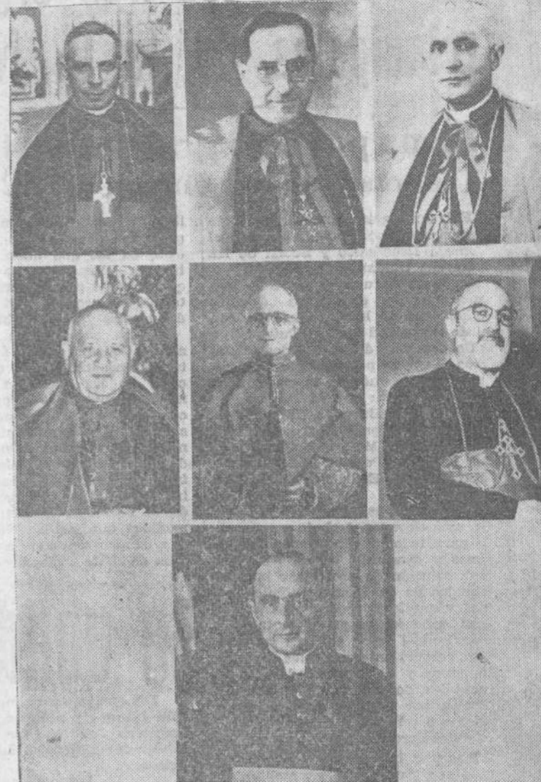
Ciudad del Vaticano.— Entre las jerarquías de la Iglesia con las que más se especula como posibles sucesores del Papa Pío XII, figuran estos siete nombres: Arriba, de izquierda a derecha: Cardenal Giacomo Lercaro, Arzobispo de Bolonia, de 67 años; Cardenal Giuseppe Siri, de 52 años, el más joven de los miembros del Sacro Colegio Cardenalicio; Cardenal Ernesto Ruffini, Arzobispo de Palermo, de 70 años; segunda fila, de izquierda a derecha: Cardenal Angelo Giuseppe Roncalli, de 77 años; Cardenal Valerio Valeri, de 75 años; y monseñor Gregorio Pedro Agagianian, Patriarca de Cilicia de los Armenios, de 63 años. Abajo, monseñor Giovanni Battista Montini, Arzobispo de Milán, de 61 años.

la misma ciudad, 11 años y 8 días (1492-1503).