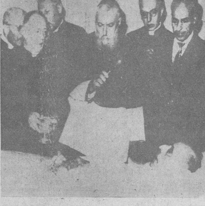
Castelgandolfo.—A los pocos momentos del fallecimiento de Su Santidad Pío XII, el decano del Sacro Colegio Cardenalicio, cardinal Tisserant, bendice al Santo Padre en su lecho mortuario.

mente mientras rezan en silencio. De la misma forma, le van millones de personas durante los tres días que su cuerpo permanecerá en la Basilica de San Pedro, en Roma, a la que será llevado esta tarde. EL TRASLADO AL VATICANO Roma.—Unas cincuenta mil personas contemplaron en Castelgandolfo la parada del cortejo fúnebre con los restos de Su Santidad Pío XII. Unos diez mil policías jalaban la ruta desde el palacio papal de verano hasta las puertas de la Basilica Catedral de San Juan de Letrán. Después de haberse permitido hasta el mediodía que fieles y peregrinos desfilaran ante los restos mortales de Su Santidad, a las dos y cuarto, guardias Nables trasladaron el féretro papal desde el salón de los Saizos hasta el patio interno de la villa papal donde miles de peregrinos fueron recibidos en audiencia cada verano. El cuerpo de Su Santidad iba vestido con todos los ornamentos y atributos papales. Una mitra blanca bordada en oro cubría su cabeza, zapatillas escarlata calzaban sus pies y en torno a sus hombros llevaba una capa ribeteada de armiño. A las dos y veinticinco minutos, mientras las campanas de