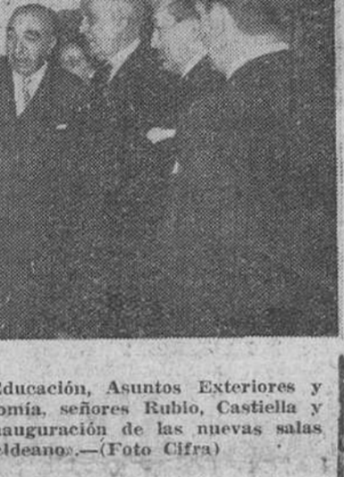
Madrid. — Los ministros de Educación, Asuntos Exteriores y presidente del Consejo de Economía, señores Rubio, Castiella y Gual Villabí, asistieron a la inauguración de las nuevas salas del Museo "Lázaro Galdeano".

Los firmantes expresan la esperanza de que, a pesar de las reiteradas negativas de los soviets, aún sea posible iniciar conversaciones de carácter técnico sobre medidas de detalle, para el control del desarme y el conocimiento de las explosiones nucleares.