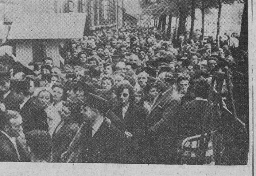
Paris. — A consecuencia de los acontecimientos políticos en Francia, las autoridades exigen un visado especial para que los ciudadanos franceses puedan salir del país, ya sea en viaje de negocios o en simples vacaciones. Por ello, miles de parisinos, como vemos en la foto, hacen cola ante la Prefectura de Policía, para obtener el visado. Muchos de ellos vendrán a España.

Londres. — Radio Argel ha hecho (Pasa a quinta página)