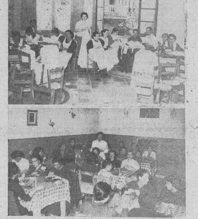
Un grupo de mujeres trabajando en el taller-escuela de la Cáritas. En segundo lugar, aspecto del comedor para obreras.

Si guiando el plan trazado de ir creando nuevos servicios, en el presente año y coincidiendo con el Centenario de Nuestra Señora de Lourdes, el 11 de Febrero, precisamente, se inauguró ben-