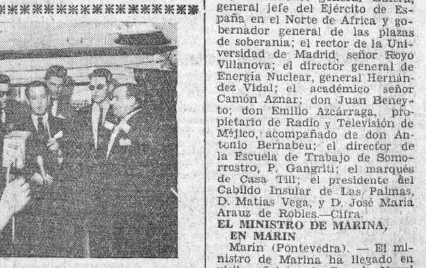
Los periodistas españoles que realizaron la información en las maniobras navales de la VI Flota, interpretan «a su aire» diversas melodías populares españolas, a bordo del «Saratoga», en honor de los marines de la flota, algunos de los cuales no quisieron perder el momento y recogieron en sus cámaras las intervenciones de los periodistas.