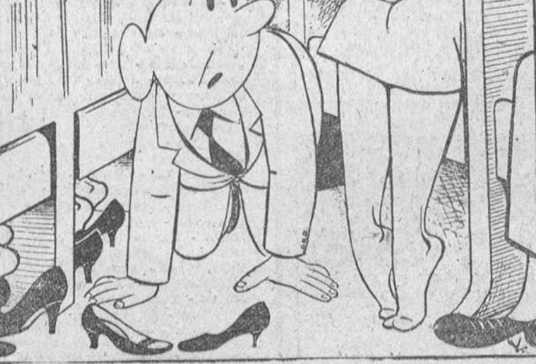
¿Cómo son tus zapatos; negros del todo?