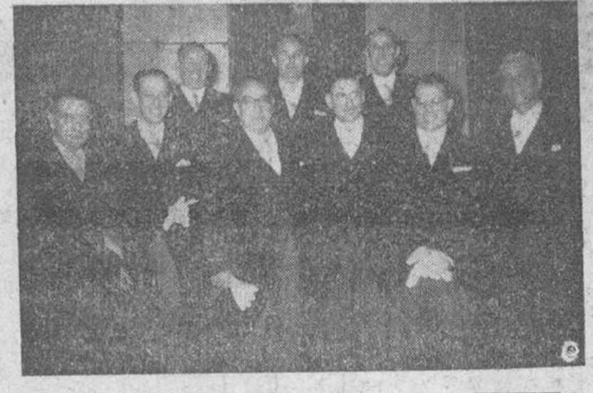
Los nuevos concejales, después de la ceremonia de la toma de posesión, celebrada el domingo, a mediodía.

También bajo la presidencia de la primera autoridad de la provincia se celebró un acto similar en Miranda de Ebro