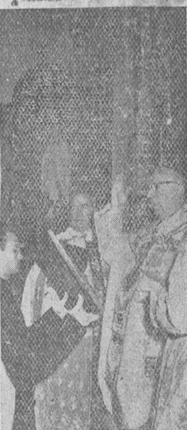
El Excmo. y Revdmo. Sr. Arzobispo de la diócesis, doctor Pérez Platero, en un momento de la solemne misa de pontifical que ofició ayer en la Iglesia de Venenades, con motivo de la conmemoración del primer centenario de las Apariciones de Lourdes.