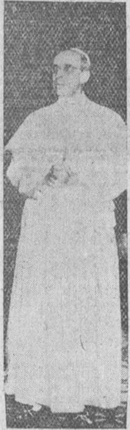
Lourdes. — El texto del mensaje de bendición dado por Su Santidad Pío XII, en francés, con motivo de la solemnidad de hoy, y leído por el Cardenal Gerlier, es el siguiente:

"Contestad al llamamiento de María con las obras de penitencia y de caridad, con las reformas personales y colectivas que os hemos encomendado"