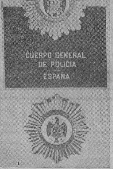
Nueva placa - insignia y carnet, distintivo y documento de identidad del Cuerpo General de Policía, establecidos por Decreto de 12 de Febrero de 1954, que empezaron a usarse ayer.