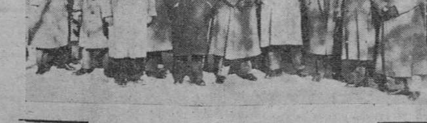
Los profesionales de la Música festejaron ayer la fiesta de su Patrona, Santa Cecilia. Después de la solemnidad religiosa que tuvo lugar en la iglesia parroquial de San Lesmes Abad, posan para nuestro periódico los asistentes a la ceremonia, entre los cuales figuran diversas representaciones.