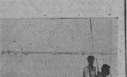
Valencia. — Después de la jornada, un grupo de cazadores de patos silvestres en las tradicionales tiradas de la Albufera, regresa en una barca donde se amontonan las piezas cobradas.