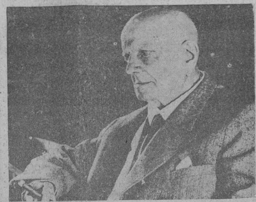
Ainola (Finlandia). — El famoso compositor finlandés, Jean Sibelius, que el próximo día 8 de Diciembre cumplirá noventa años, fotografiado en su casa de Ainola en Jarvenpaa.

Los 90 años del autor del "Vals Triste,"