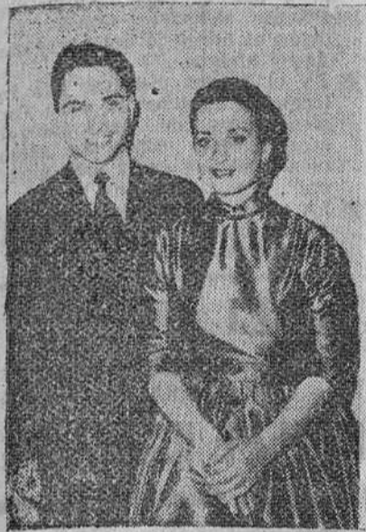
El Rey Hussein de Jordania y su esposa, la Reina Dina, que ayer llegaron a Madrid.

El Caudillo, su esposa, el Gobierno y otras altas personalidades españolas acudieron a Barajas