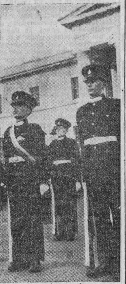
En formación con otros ochocientos oficiales caudetes, aparece en el centro S. M. el Rey Hussein de Jordania.

Monarca en nombre del pueblo madrileño. Aclamados con verdadero fervor, poco después reemprendió la marcha el cortejo por el paseo de la Castellana.