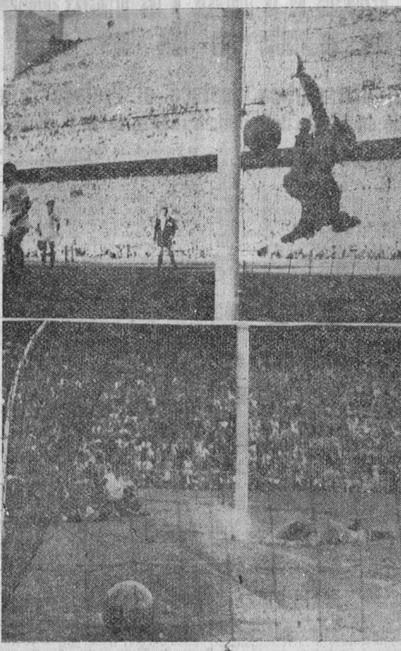
Los momentos del gol con el que obtuvo el triunfo el Atlético de Bilbao. En la parte superior, el balón va derecho al poste lateral, pese a la estridida de Bustos. En la fotografía inferior, el esférico aparece ya dentro del marco, mientras el portero sevillano, en el suelo, queda profundamente zbatido.