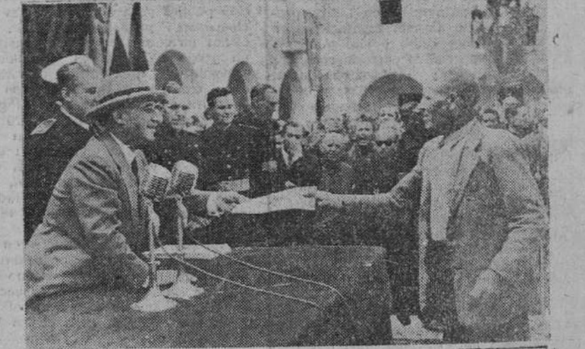
S. E. el Jefe del Estado hace entrega de los títulos de propiedad a los colonos de uno de los pueblos de reciente constitución.

La acción social en la Agricultura es una obra que impulsa con vivo interés el Ministerio del ramo, con el fin de lograr un aumento en la producción que proporcione un mejor nivel de vida a los agricultores; de conseguir en el medio agrario la reducción del natural paro estacional y elevar al obrero agrícola a la condición de propietario y evitar el abrutecimiento, creando trabajo y riqueza, así como viviendas cómodas y gratas en los medios rurales.