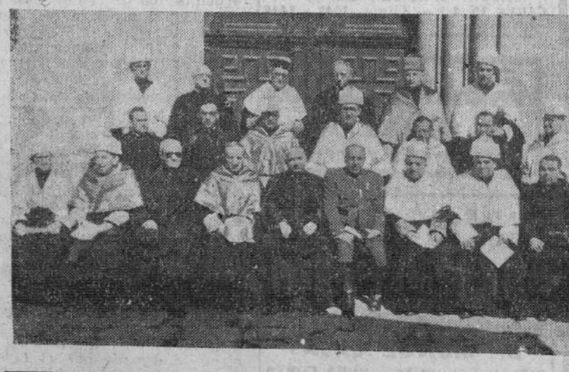
Con la solemnidad acostumbrada se celebró ayer en el Seminario diocesano de San Jerónimo la apertura del curso académico 1955-1956. En la foto aparece el claustro de profesores, acompañado de varias de las personalidades que asistieron al acto.