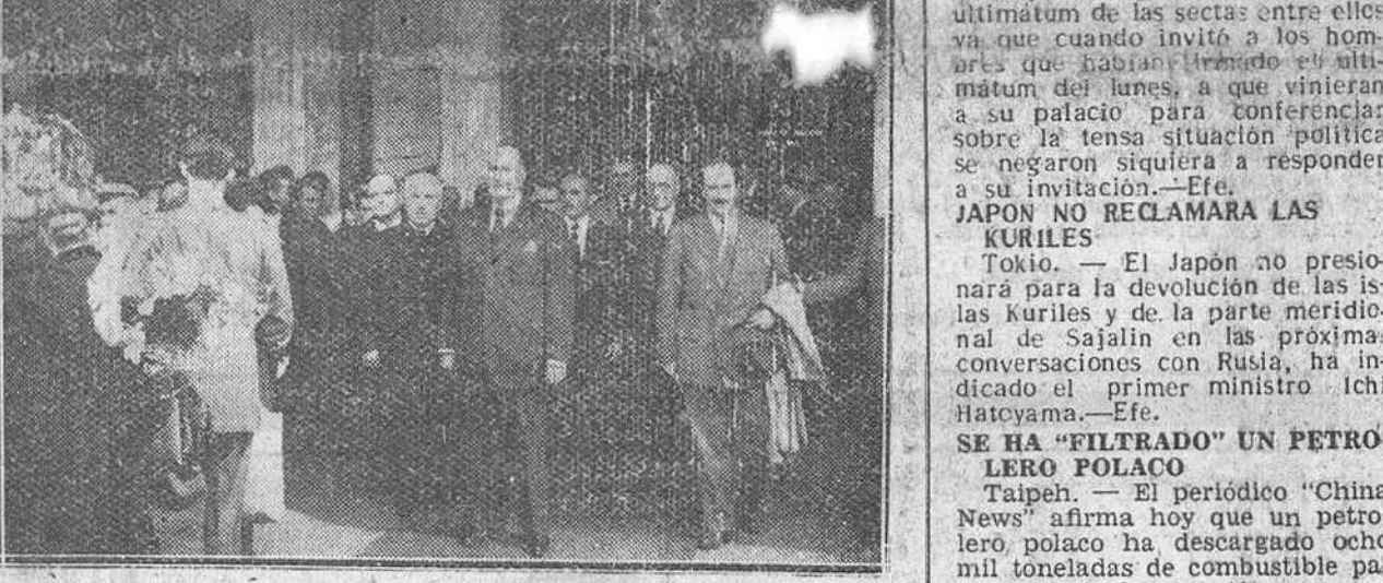
Madrid. — Un momento de la llegada a esta capital, por la estación del Norte, del conde de Vellalano, después de su visita a Cuba presidiendo la misión extraordinaria española en la toma de posesión del presidente Batista. Acudieron a recibirle varios ministros del Gobierno y otras personalidades.