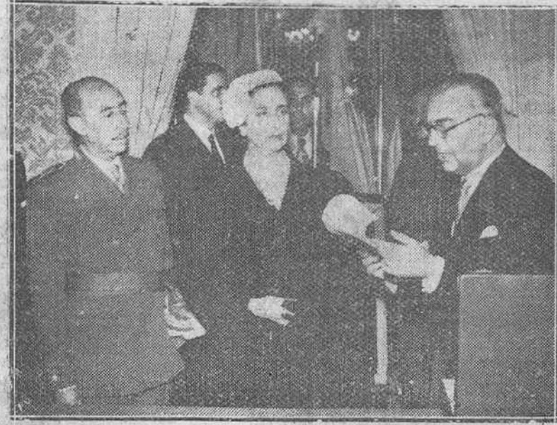
Madrid. — La esposa de S. E. el Jefe del Estado, doña Carmen Polo de Franco inaugura solemnemente los salones del nuevo Centro Asturiano de Madrid, del que ha sido nombrada presidenta de honor.