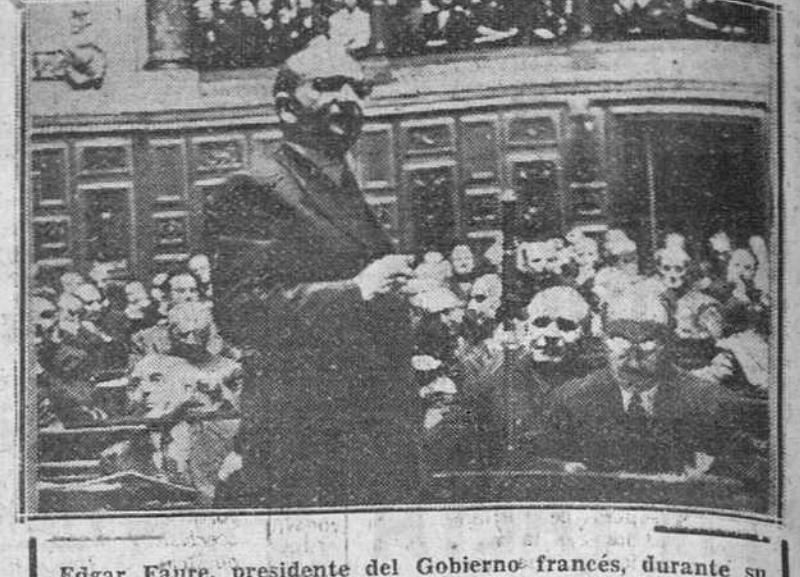
Edgar Faure, presidente del Gobierno francés, durante su intervención ante los senadores del Consejo de la República en los debates sobre los acuerdos de París.