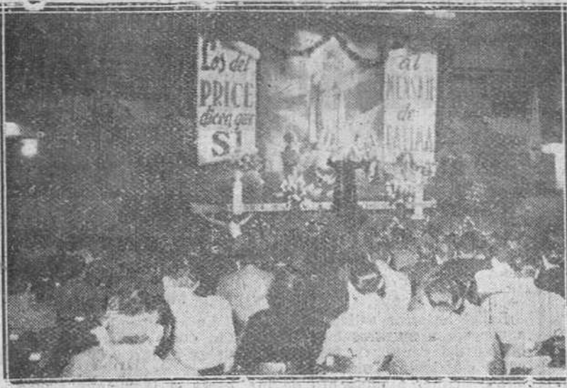
Barcelona.—Un aspecto de la sala del Price de esta capital a las dos de la mañana, donde se celebran conferencias cuaresmales para artistas y camareros, organizadas por la Asesoría Religiosa de los Sindicatos.