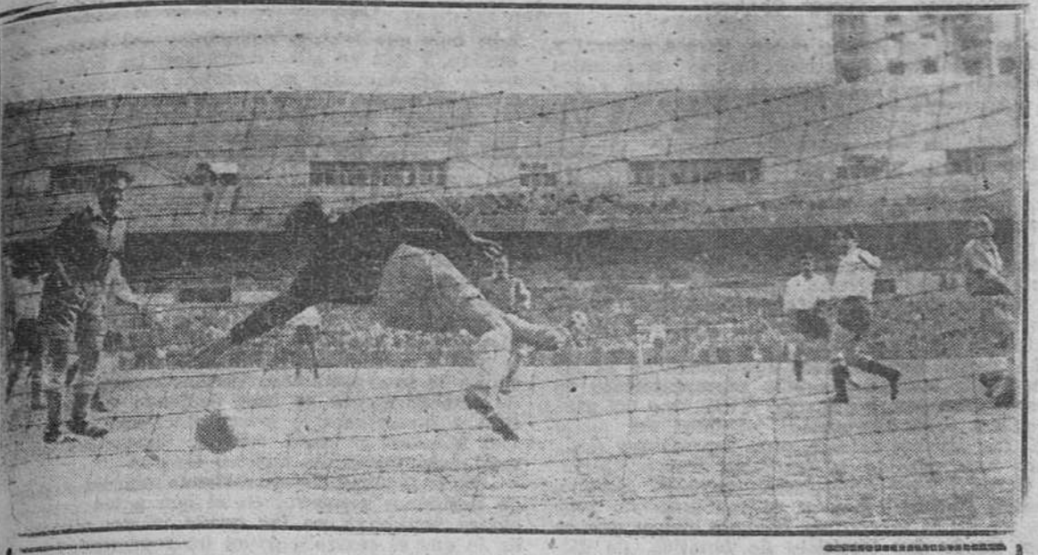
El tercer gol de la selección nacional en el partido contra el Saarbrücken logrado por Gainza de un tiro cruzado.