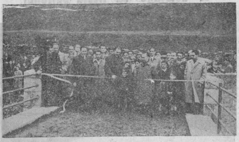
El gobernador civil de la provincia, señor Posada Cacho procede a cortar la cinta simbólica de inauguración de un puente en Espinosa de los Monteros, acto que tuvo lugar el sábado último, con asistencia del presidente de la Diputación y otras jerarquías.