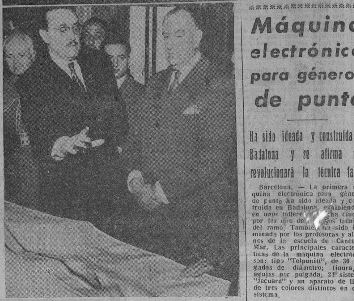
El ministro de Obras Públicas, conde de Vallellano, posa para nuestro periódico, con todas las autoridades y representaciones que acudieron a su despacho oficial para entregarle el proyecto de nuevo acceso a Burgos por la carretera de Madrid. En la fotografía inferior, el alcalde explicando al ministro las particularidades más importantes de dicho plan.

Las mencionadas autoridades y representaciones se congregaron a mediodía en el Ministerio de Obras Públicas, siendo recibidas a las doce y media por el conde de Vallellano, que acogió complacido a la comisión burgalesa, con la que se apartó durante más de media hora. Una vez en el despacho del ministro y efectuadas las presentaciones por el gobernador civil, señor Posada Cacho, el Prelado de la diócesis burgalesa, doctor Pérez Platero, en breves palabras, se en esa doble realidad, de que Burgos, representada por sus autoridades y jerarquías en íntima comunidad de fines, acudia ante el conde de Vallellano, tan encariñado con esa ciudad y provincia, para trasladar un trascendental acuerdo adoptado por el Ayuntamiento de la Cabeza de Castilla, problema del más alto interés como lo demostraba el hecho de la propia presencia de dichas representaciones.