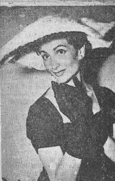
París. — El sombrero ancho siempre ha tenido éxito. He aquí uno de melusine, en tono blanco-azulado, de la firma Maud.