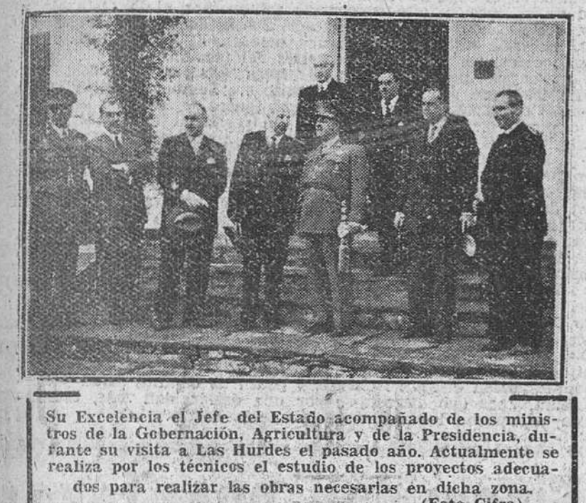
Su Excelencia el Jefe del Estado acompañado de los ministros de la Gobernación, Agricultura y de la Presidencia, durante su visita a Las Hurdes el pasado año.

UNA síntesis de la labor desarrollada por el ministro de la Gobernación, Don Blas Pérez González, al frente del Departamento que regenta desde hace años, resulta poco menos que imponente por el volumen de asuntos y temas de fundamental interés para la vida del país.