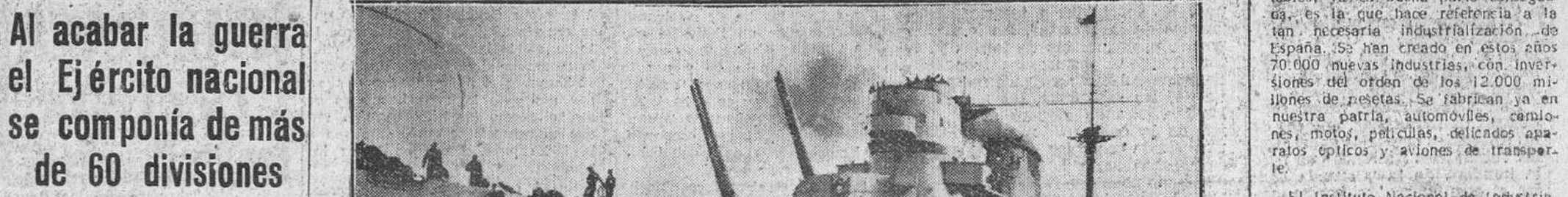
El cruceo "Canarias", que tan destacada actuación tuvo en la lucha marítima contra la escuadra roja, en los días cruciales de nuestra Guerra de Liberación, cubriéndose de gloria en multitud de acciones guerreras.

García Morato abatió más de 40 aviones adversarios