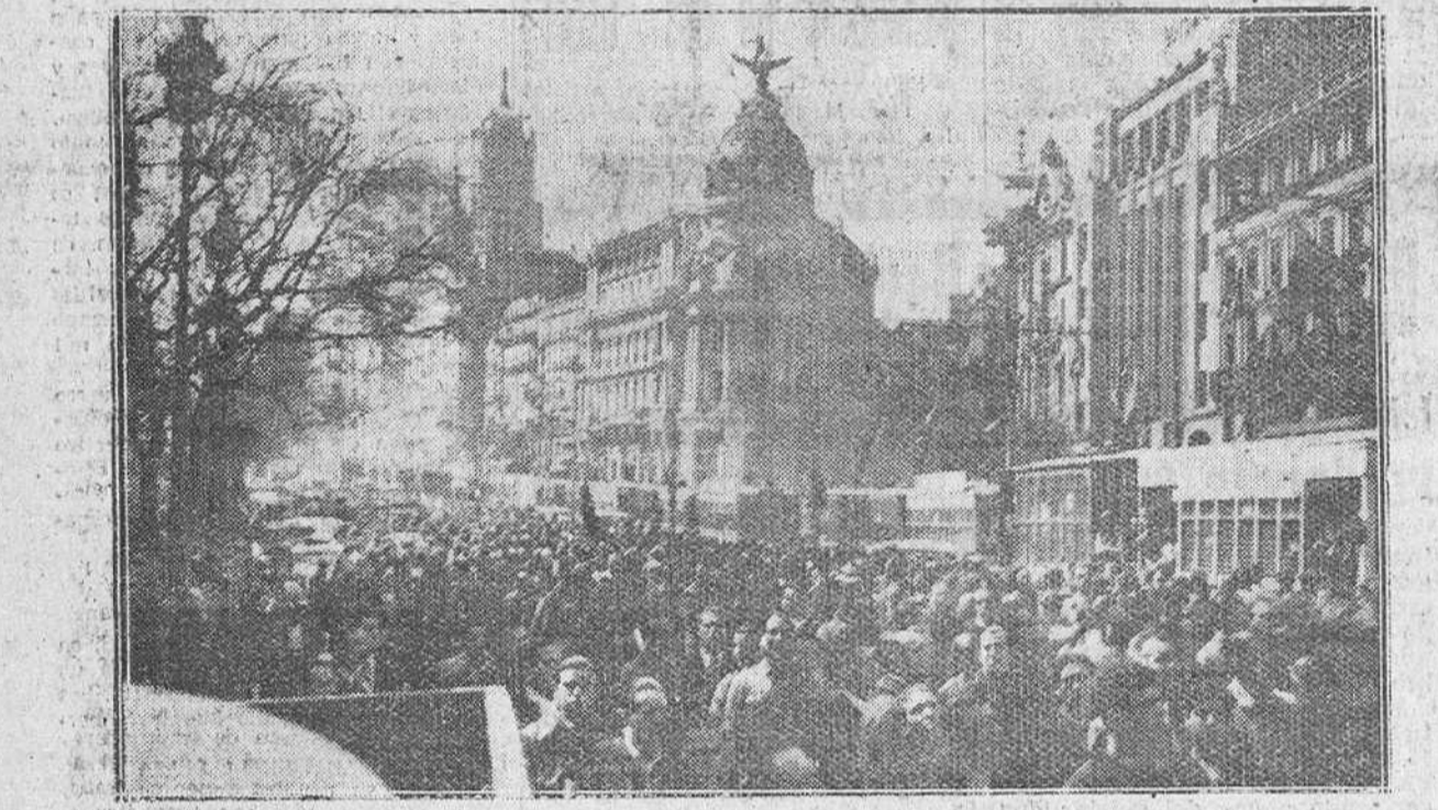
Madrid entero, y como Madrid, España, se le hizo a la calle, para aclamar al glorioso Ejército español que tras tenaz lucha, jalónada de hechos heroicos, logró expulsar del suelo patrio al ejército comunista.