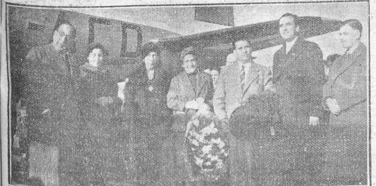
Madrid. — Un momento de la llegada al aeropuerto de Barajas de don Oscar Herrera Palacios, ministro de Educación Pública de Chile, que fue recibido por el ministro de Educación, señor Ruiz Giménez, el embajador de su país en España y otras personalidades.