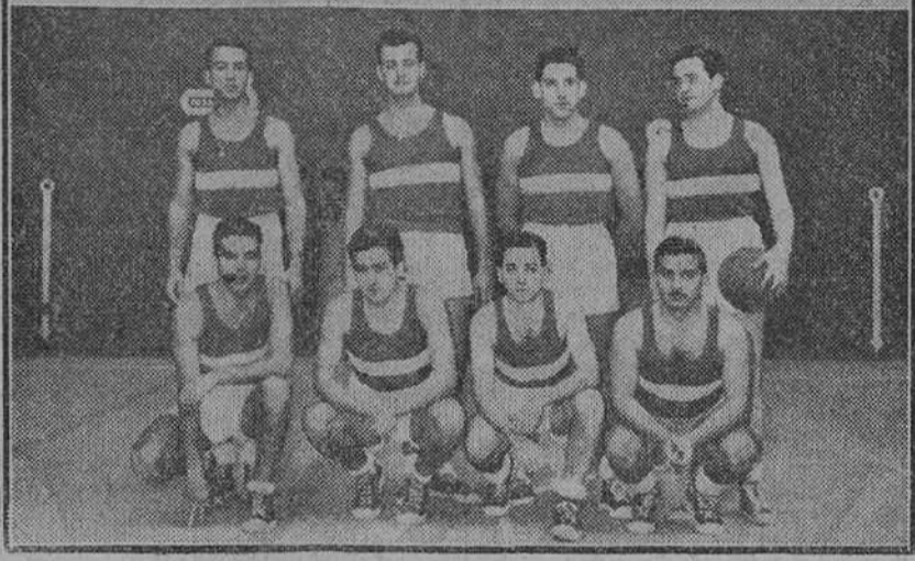
Los equipos de la "Bazán" y de la Academia de Ingenieros, que el domingo jugaron un encuentro amistoso de baloncesto, en el frontón cubierto de la Ciudad Deportiva.

En la mañana del domingo y en el frontón cubierto de la Ciudad Deportiva Militar se celebró el anunciado partido de baloncesto entre los equipos de la "Bazán" y de la Academia de Ingenieros de Burgos. La expectación despertada por el partido había sido extraordinaria y la afición correspondió como se merecía al equipo bazanista, acudiendo en masa a verlo jugar. Salieron al campo los jugadores de ambos conjuntos, entre los cuales se hizo el acostumbrado intercambio de banderines. Comenzó el juego con cierto dominio por parte de los burgaleses, que dieron sensación de rapidez y conjunción, mientras que los ferrolenses aplicaban la táctica del hombre a hombre para tantear a los jugadores burgaleses. Fruto de esta táctica fué que el partido adquiriera emoción, ya que el "San Fernando", se adelantó en un principio en el marcador.