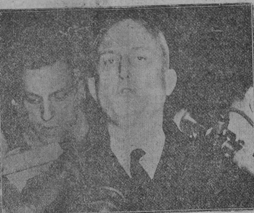
El diputado francés Mr. Pflimlin, que tras sus gestiones para formar nuevo Gobierno ha fracasado en las negociaciones, al negarse a colaborar con el socialista Pineau y los "gaullistas".

Este promete seguir los métodos empleados por Mendes-France