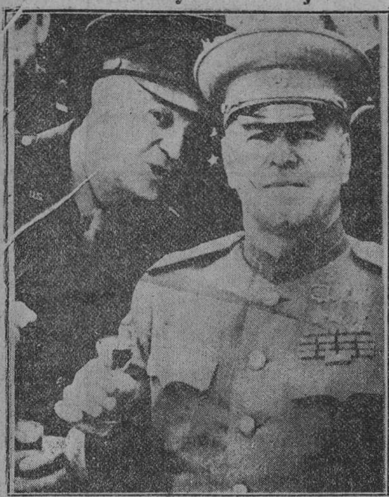
Francfort. — Es una fotografía retrospectiva, tomada en 1945 y en la que el presidente norteamericano aparece brindando por la victoria de las fuerzas aliadas con el mariscal Zukof, nuevo ministro de Defensa soviético.