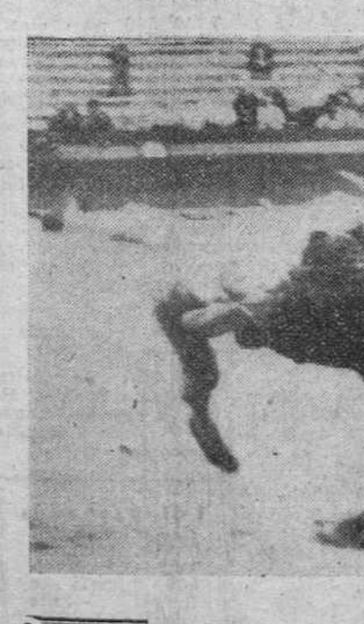
Valencia. — El impresionante momento de la gravísima cogida que sufrió el pasado domingo en esta plaza, el novillero norteamericano Potter Tuck, cuando lidiaba a su segundo novillo.

Gravísima cogida del torero norteamericano Potter Tuck